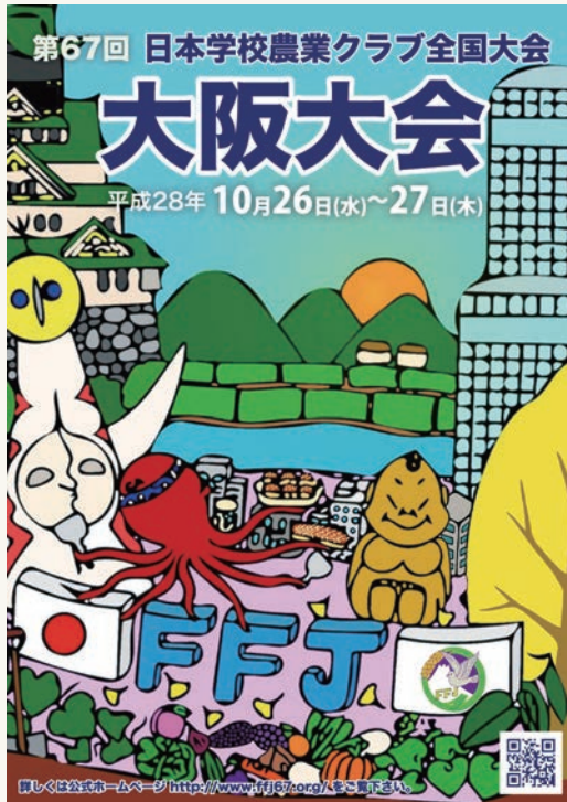
大阪大会ポスター